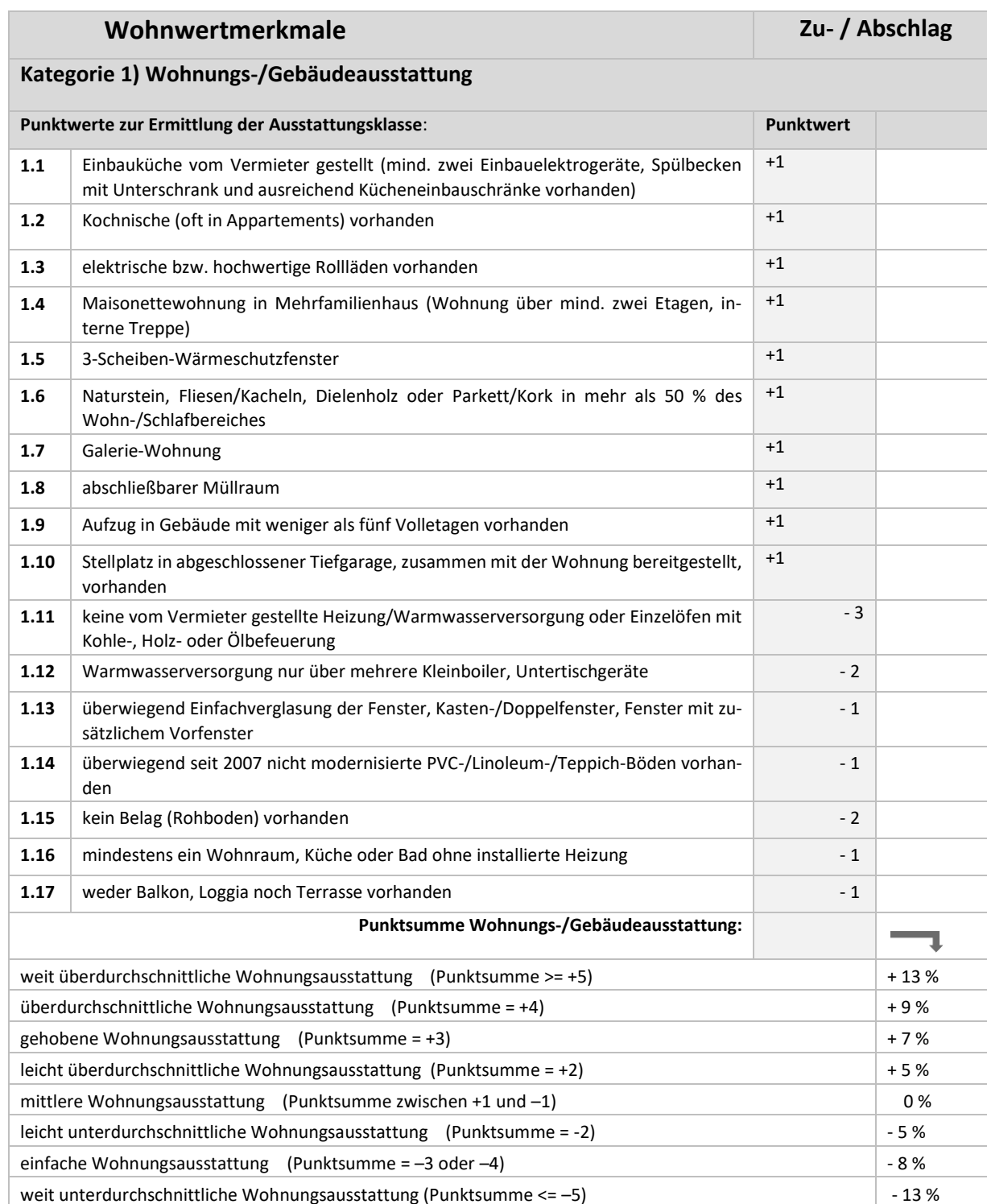
Tabelle 2: Weitere Wohnwertmerkmale, die den Mietpreis signifikant beeinflussen